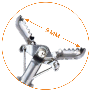
GROTE SPANWIJDTE VOOR GROTE WEEFSELMONSTERS

De biopsietang blinkt uit in de praktijk dankzij het inbrenggemak en de uitstekende beweeglijkheid. Hierdoor bereikt u het te onderzoeken gebied snel en probleemloos. Bij het afnemen van weefselmonsters maakt de tang indruk door zijn precieze controle en nauwkeurige snede. Dankzij de bijzonder scherpe snijrand van de lepels, kunnen met de tang biopten gericht worden genomen. De kracht die hiervoor nodig is, is minimaal. Het verkregen biopt is groot en levert dus voldoende weefsel voor een betrouwbare diagnose.